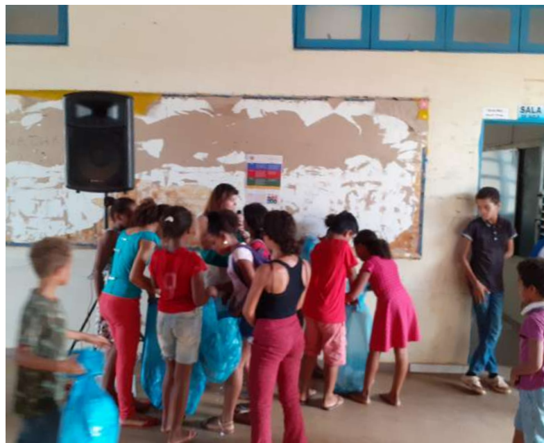
Adolescentes durante gincana de coleta seletiva sobre o ODS 11 Cidades e Comunidades Sustentáveis.